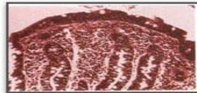
Çölyak hastalığının ileri safhasında emilim yapamayan ince bağırsağın içten görünüşü