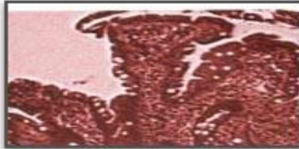
Çölyak hastalığının başlangıcında ince bağırsağın içten görünüşü