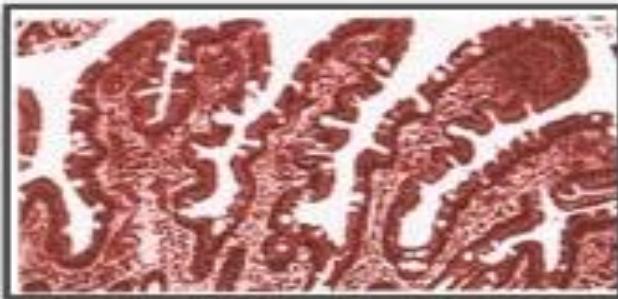
Sağlıklı ince bağırsağın içten görünüşü